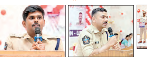
మాట్లాడుతున్న జిల్లా ఎస్పి జగదీష్