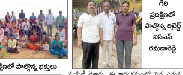
గిరి ప్రదక్షిణలో పాల్గొన్న భక్తులు

కదిరి, మే 29 ప్రభాతవార్త ప్రసిద్ధి నవనరసింహా క్షేత్రాలలో ప్రవహించే సమేతంగా స్వయంభూగా వెలసిన పవిత్ర పుణ్యక్షేత్రం శ్రీమతీవారి లక్ష్మీనరసింహా క్షేత్రంలో శ్రీవారి జన్మనక్షత్రం స్వామి సందర్శనగా శుక్రవారం భక్తులు పెద్ద సంఖ్యలో పాల్గొని భక్తి క్రోధలతో నోరెత్తిన గిరి ప్రదక్షిణ నిర్వహించారు. ఈ క్షేత్రానికి సుమారు ఐదు కిలోమీటర్ల దూరంలో ఉన్న నోరెత్తిన భక్తులకు కదిరి కొండగా ప్రసిద్ధి చెందింది. ఇక్కడ లక్ష్మీ కొండల లక్ష్మీనరసింహస్వామి, కాటమ రాయయలు వెలసి ఉన్నారు, శ్రీవారు ఈ ప్రాంతంలో పాదం మోపారని భక్తుల ప్రగాఢ విశ్వాసం. ఈ నేపథ్యంలో ప్రతి నెలా స్వామి నక్షత్రం సందర్శనగా నిర్వహించే గిరి ప్రదక్షిణలు పెద్ద సంఖ్యలో భక్తులు పాల్గొని పాఠశాలలో పాల్గొంటున్నారు. గోవింద నామస్మరణల మధ్య సాగిన ఈ గిరి ప్రదక్షిణ అధ్యాత్మిక వాతావరణాన్ని సంతరించుకుంది. గిరి ప్రదక్షిణలో భక్తులకు అంది అధికారులు, శ్రీ లక్ష్మీనరసింహస్వామి సేవా సమితి సభ్యులు ప్రసాదం, మజ్జిగ పాకెట్లు, స్నీక్ బాటిళ్లను