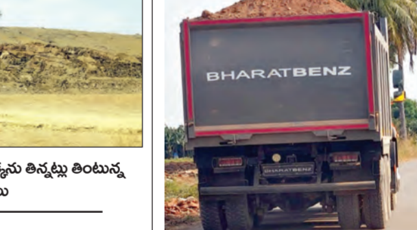
అక్రమంపై సుంక అక్రమంగా మళ్ళీ తరలింపున వాహనాలు

రామలచెరువుపల్లి 'బెనాక్ట్ వంటి చెరువు వైపు దూసుకొస్తున్న విద్యుత్ కార్యక్రమం చింతలూరుపల్లి సమీపంలోనూ, అక్షంపల్లిలోని మాన్యం భూముల్లోనూ, యాడి-కోమలపాడు మధ్యన నెలల తరలంటే అక్రమంగా మళ్ళీ తరలింపు చేపట్టినా పట్టించుకోవడం లేదు. పిన్నపల్లి చెరువులో మళ్ళీ తరలింపు కూడా అధికారుల పాతకం తరచూ వివాదాస్పదంగా మారుతోంది. ఇలా అక్రమంగా మళ్ళీ తరలింపు చేస్తున్న వారికే రెవెన్యూ కార్యాలయంలో రెడ్ కార్పొరేట్ వేసి గౌరవం పెంచడం పట్ల తీవ్ర విమర్శలు వ్యక్తం చేస్తున్నా. ఈ వర్గీకరణ చూసి అక్రమాలను, అధికారులకు ముప్పు కల్పించాలి. అక్రమాలపై ఫిర్యాదు చేయడం ద్వారా ప్రజలు సమయం రావడం లేదు. తాము కూడా అధికారంలోకి వస్తే ఇవే మార్గాలు అనుసరించి సంపాదించుకోవద్దు” అని ప్రతిపక్ష నాయకులు, తామెంత ఘాటుగా స్పందించినా అధికారుల చర్యలు తప్పవని, ఏదో ఒక నాయకుడు సహాయం.. ఇతర అక్రమాలను ప్రజాస్వామ్యం నాయకులు మిస్సినట్లు డిఫిండెంట్ అక్రమాలను, అధికారులు అడింట్ ఆట పాడింట్ పాటు చలమంటే అవుతోంది. ఇక మంబలంలోని విలువైన